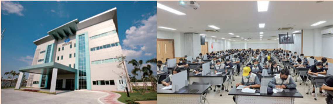
図1 タイ工場に隣接して設置されたトレーニングセンターとテスト受講風景